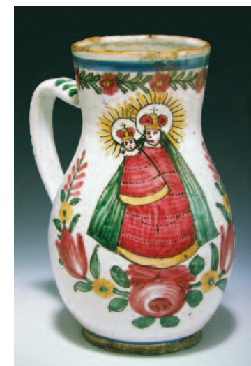
Fajánsový džbán s vyobrazením Panny Marie, Vyškov, první třetina 19. století. Etnografická sbírka Národního muzea.

Summer House Kinský at the time of its completion with a view of the original vineyards on the slopes of the Petřín Hill. Representative entrance of the building that is now the rear part of the object. Watercolor painting by Antonín Mánes from 1831.