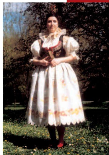
Děvče v obřadním kroji družičky z jihočeských Blat z období 1. poloviny 19. století. Oblecení sestavené z krojových součástí Etnografické sbírky Národního muzea.

Girl in the ceremonial costume of bridesmaid. Blata region in South Bohemia, the first half of the 19th century. The costume was put together from individual items from folk costume collection. Ethnographical Collection of the National Museum.