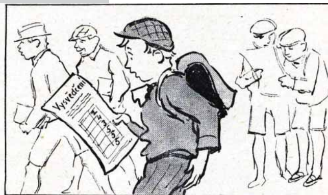
Počítá, co mu to vynese ...

Mikulášský podvečer se soutěžním operním kvízem „Znáte Smetanu?“ Vstup zdarma od 17 hod.