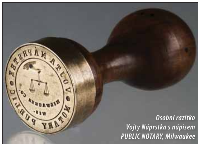
Osobní razítko Vojty Náprstka s nápisem PUBLIC NOTARY, Milwaukee

Ke 115. výročí úmrtí českého vlastence, národopisce, cestovatele, sběratele, mecenáše, podnikatele i politika připravilo Národní muzeum výstavku jeho pokladů – vystavené unikátní předměty připomínají jeho emigraci ve Spojených státech amerických v letech 1848–1857.