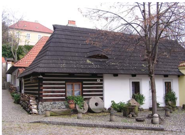
Domek U Raka na Novém Světě na Hradčanech: někdejší bydliště Arbesovy ženy Josefiny i dějiště povídky Zázračná madona.

V jednom ze stísněných pokojíků roubeného stavení U Raka také žila (či spíše živořila) ve druhé polovině 19. století rodina nemajetného soustružníka