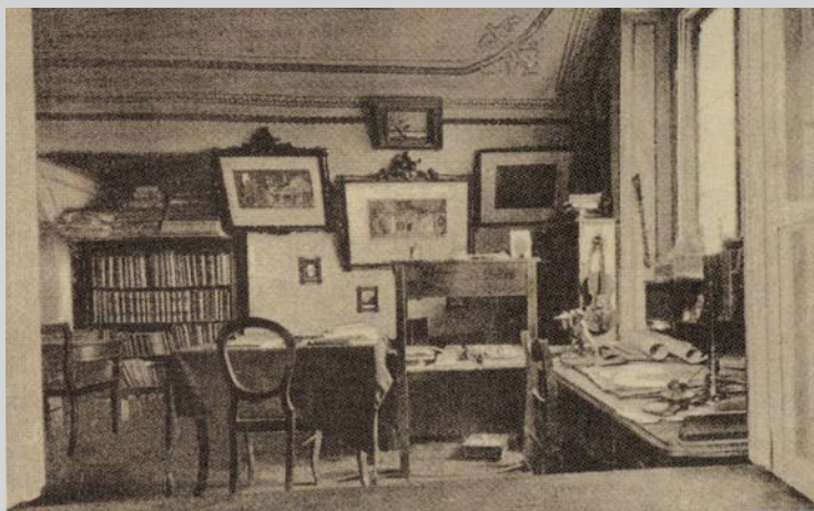
Kaplanka na klecanské faře, v níž V.B.T. osm let bydlel

Tzv. Kaplanka na faře v Klecanech, ve které V. Beneš Třebízský 8 let bydlel.