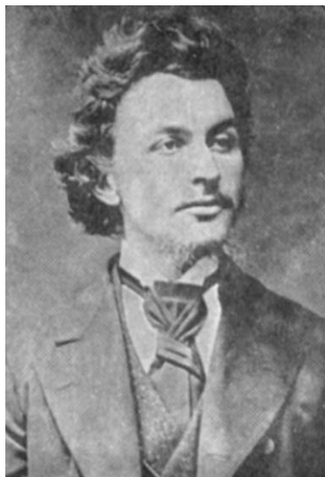
Aleš Balcárek (1840–1862)

roku 2000, jež pořádá kulturní odpoledne a literární soutěže na připomínku výročí narození a úmrtí básníka.