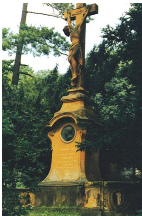
Pomník V. Beneše Třebízského v Klecanech z roku 1894, jehož autory jsou J. V. Myslbek, J. Mařatka a J. Stibral.