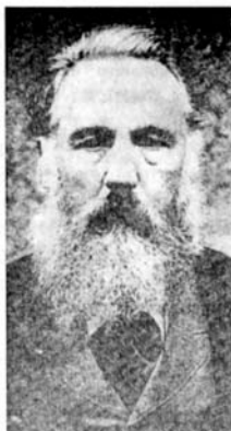
チェスノフリーデク

チェフの膨大な詩や散文の作品は壮大な叙事詩集 (「ヨーロッパ Evropa」, 「スラーヴィエ Slávie」), 歴史的詩集 (「ジシユカ Zizka」, 「ダグマル Dagmar」), 政治的な抒情詩集 (「朝の歌 Jitřní písně」, 「新しい歌 Nové písně」), 詩の風刺集 (「ハヌマン Hanuman」), 田舎の生活を描写した牧歌的な詩の物語集 (「菩提樹の木陰で Ve stínu Lípy」) などが含まれる。最も名声を博したのは 1883 年の彼の詩的な社会的小説、「レシェチンスキーの鍛冶屋