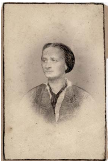
Daguerrotypie Boženy Němcové, pochází asi z let 1855 - 1856