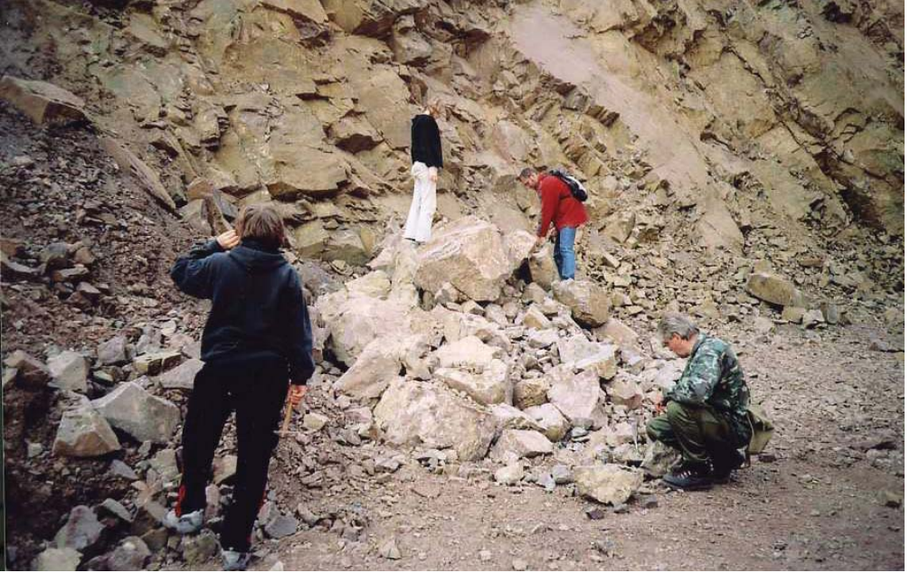
Členové mineralogické sekce při sběru v lomu v Doubravici