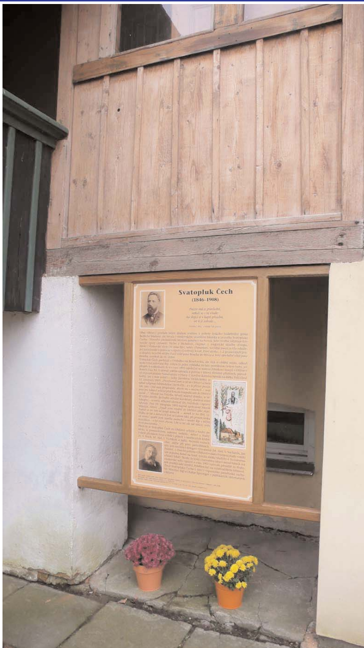
Informační tabule (Svatopluk Čech – život a dílo), umístěná od října 2008 na domku S. Čecha v Obřívství.