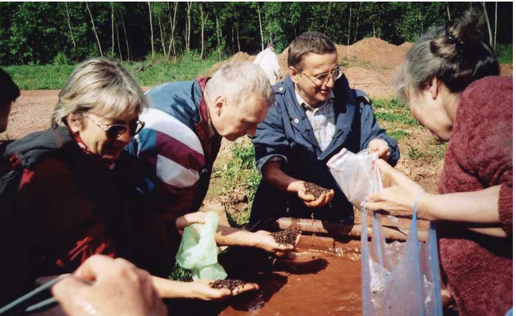
Rýžování granátů ve Vestřeví u Vrchlabí