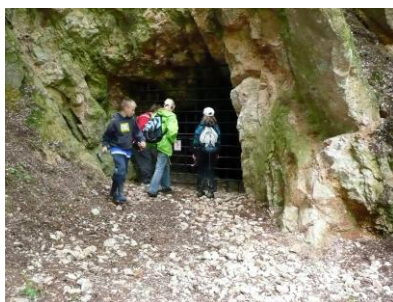
Foto – exkurze mineralogické sekce SNM