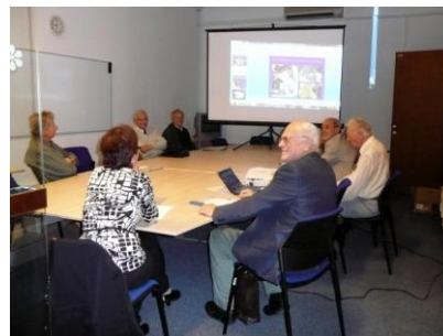
Foto – z exkurze mineralogické sekce a pohled do nové zasedací místnosti výboru SNM v nové budově NM.