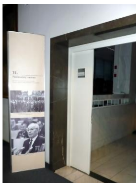
Foto – vstup do zasedací místnosti SNM