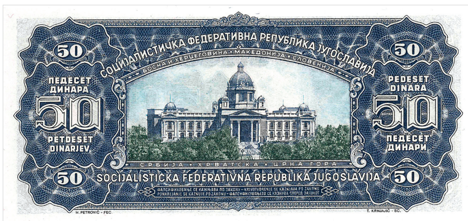
Obr. 3. Bankovka o hodnotě 50 dinárů z r. 1965.