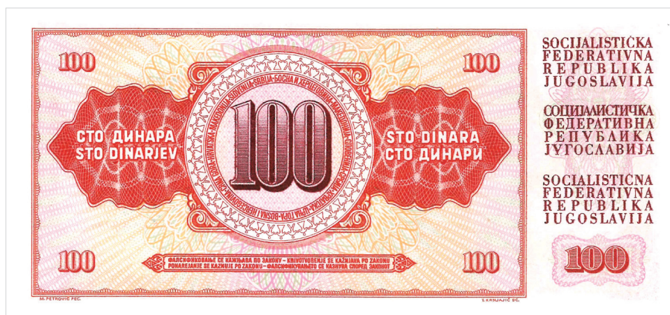
Obr. 4. Bankovka o hodnotě 100 dinárů z r. 1965.