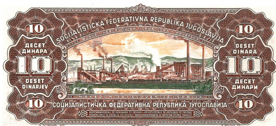
Obr. 2. Bankovka o hodnotě 10 dinárů z r. 1965.