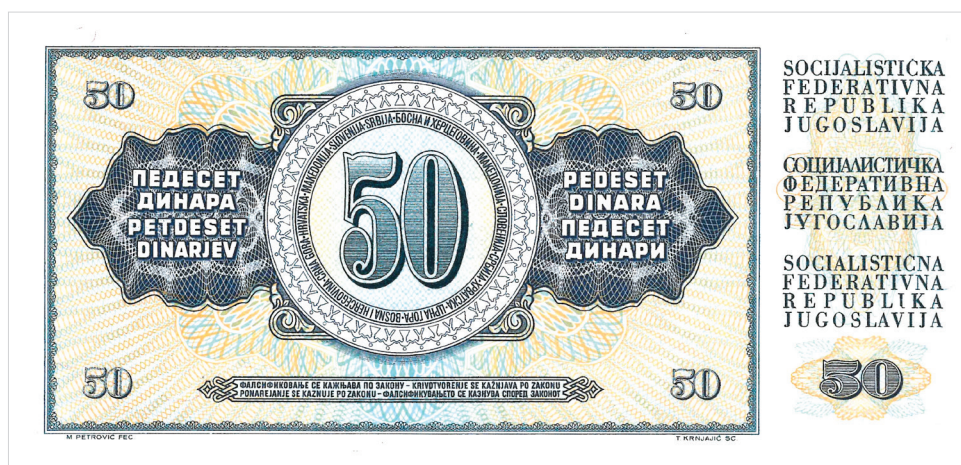
Obr. 7. Bankovka o hodnotě 50 dinárů z r. 1968 (foto autor).