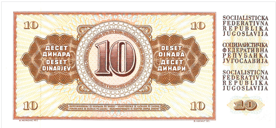
Obr. 6. Bankovka o hodnotě 10 dinárů z r. 1968.