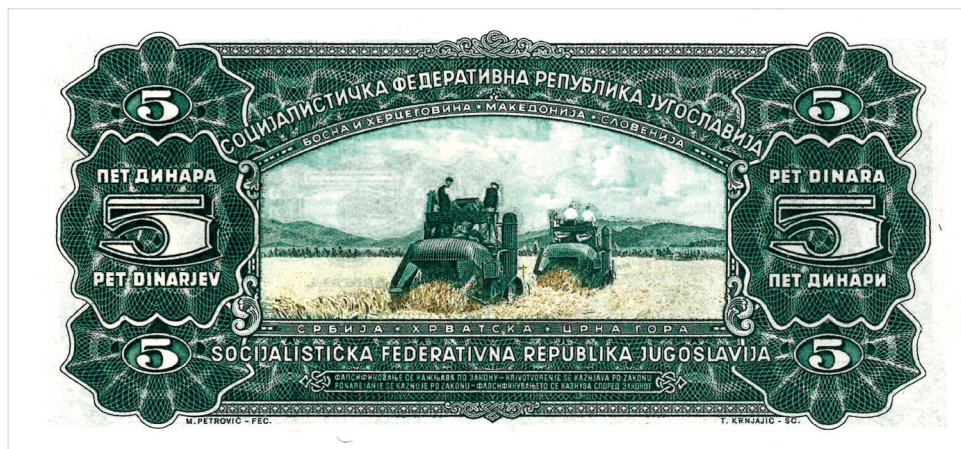
Obr. 1. Bankovka o hodnotě 5 dinárů z r. 1965.