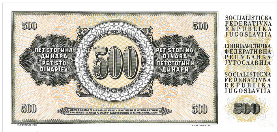
Obr. 8. Bankovka o hodnotě 500 dinárů z r. 1970.