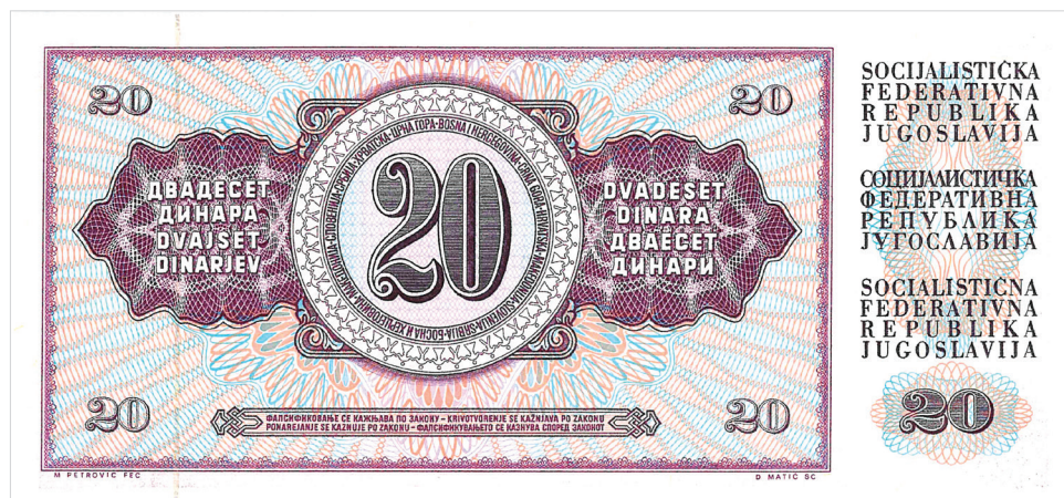
Obr. 9. Bankovka o hodnotě 20 dinárů z r. 1974.