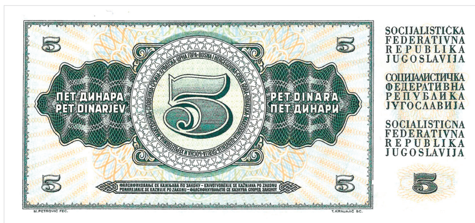
Obr. 5. Bankovka o hodnotě 5 dinárů z r. 1968.