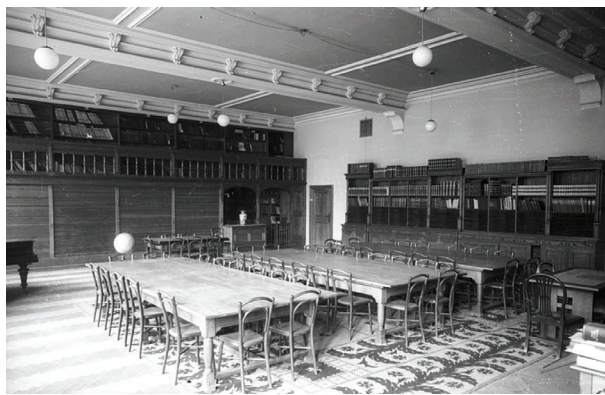
Obr. 6. Knihovna Severočeského muzea v roce 1949.

práce musea“. 53 Tehdejší ředitel muzea Vlastimil Vinter přesně pojmenoval úkoly, které bylo třeba splnit. Vedle standardních požadavků na reorganizaci, utřídění, vytvoření katalogů a vypracování systému výpůjček tu zazněly také požadavky, které byly závislé na dostatku financí na nákup literatury a personálního zajištění.