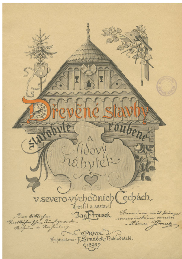
Obr. 2. Věnování autora knihy Severočeskému muzeu.