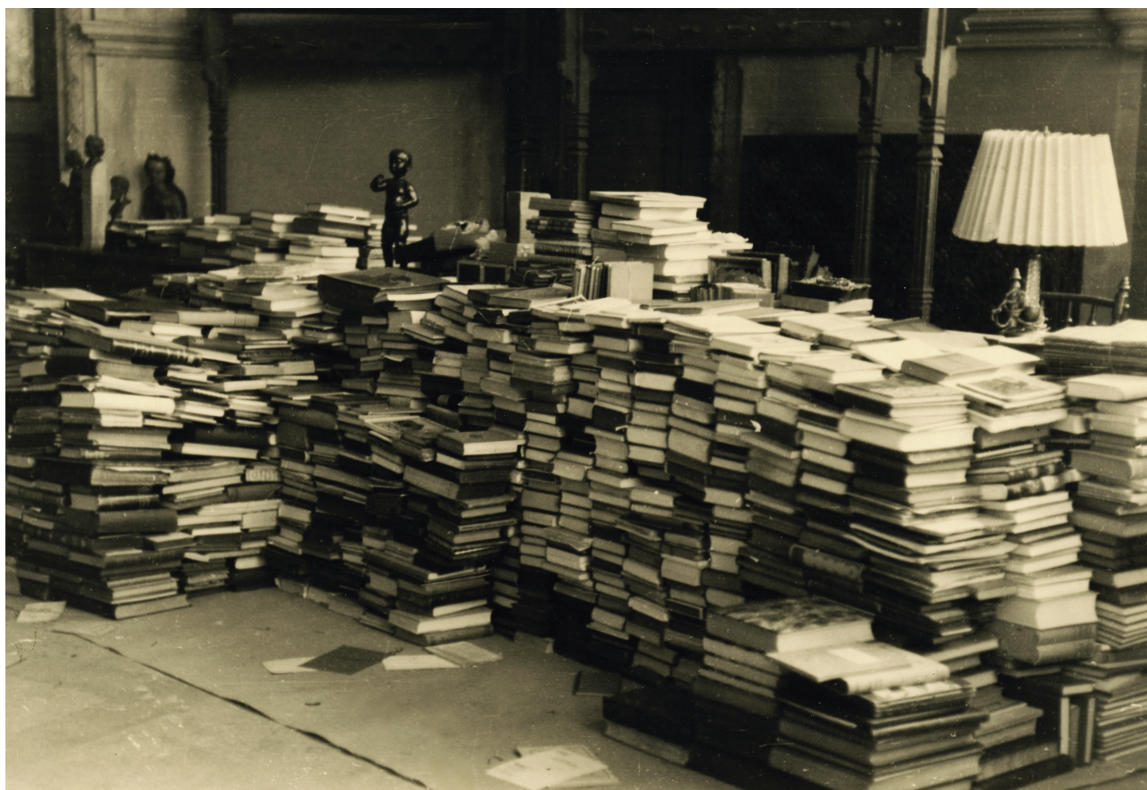
Obr. 5. Zajištěné knihy uložené před vchodem do knihovny.

Naturfreunde ). Vedle doporučení pro uspořádání sbírek bylo také pamatováno na knihovnu. Směrnice uvádí, že uspořádání studijní a příruční muzejní knihovny má být svěřeno knihovníkovi, aby „nebylo nutno zaměstnávat muzejní personál“. Tento dokument tak posvětil zachování muzejní knihovny, ačkoliv se ozývaly i hlasy o její nadbytečnosti. Ty se opíraly o skutečnost, že zde už v průběhu roku 1945 došlo k obnově provozu dvou velkých knihoven 48 – liberecké městské knihovny a Státní studijní knihovny, nazývané také univerzitní. 49