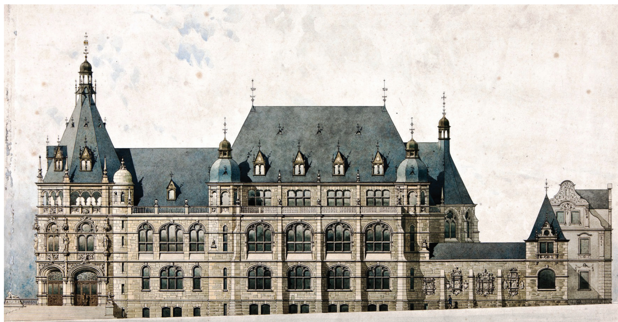
Obr. 3. Návrh nové muzejní budovy.

katalogu. Dva dosud vydané tištěné katalogy z let 1888 a 1896 měl doplnit navazující vícedílný katalog s přehledem přírůstků od roku 1896. Muzeum nakonec v roce 1908 vydalo pouze první díl, který byl tematicky věnován architektuře a stavitelství.