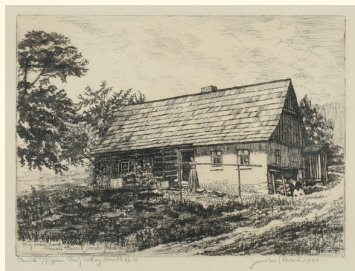
Skrbkův rodný domek čp. 16 v Poniklé nad Jizerou, 1930 (Krkonošské muzeum ve Vrchlabí)