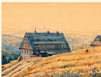
Jaroslav Skrbek: Dvorská bouda, 1924 (Krkonošské muzeum ve Vrchlabí)