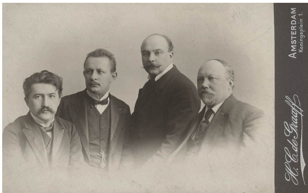
The Bohemian Quartet in its second incarnation (from the left Josef Suk, Karel Hoffmann, Oskar Nedbal, Hanuš Wihan), / České kvarteto ve druhém složení (zleva Josef Suk, Karel Hoffmann, Oskar Nedbal, Hanuš Wihan)

Dvořák. Kdyby můj kvintett zněl v obsazení tak, jak si to představuji, vysmál bych se všem špatným kritikám a hněvu celého světa. 28