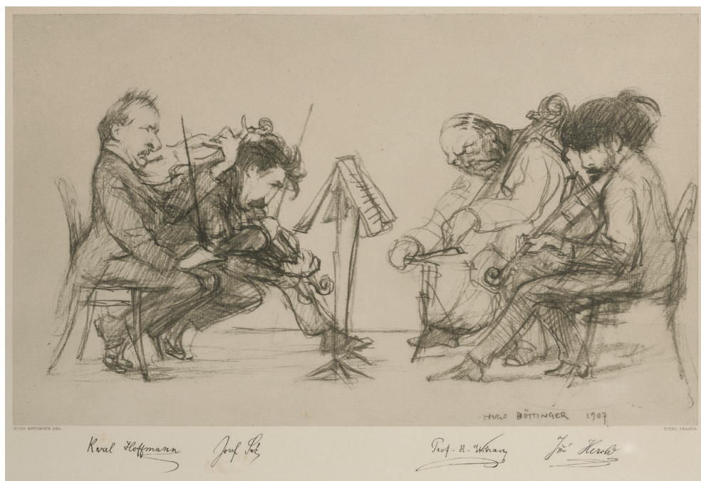
The Bohemian Quartet in its third incarnation (from the left: Karel Hoffmann, Josef Suk, Hanuš Wihan, Jiří Herold), caricature: Hugo Boettinger, 1907. NM-ČMH F 6930. / České kvarteto ve třetím složení (zleva Karel Hoffmann, Josef Suk, Hanuš Wihan, Jiří Herold), karikatura: Hugo Boettinger, 1907. NM-ČMH F 6930.

ředitel moskevské konzervatoře Sergej Tanějev, a německý klavírista a skladatel Conrad Ansoerge. 22 V následujícím roce pak přijeli neméně významní umělci – vynikající německý klavírista Wilhelm Backhaus a trio Hugo Becker (německý violoncellista), Henri Marteau (švédský houslista) a Ernest von Dohnányi (maďarský klavírista). Posledně jmenovaní vystoupili na večeru Českého spolku pro komorní hudbu v Rudolfinu 27. března 1909. 23