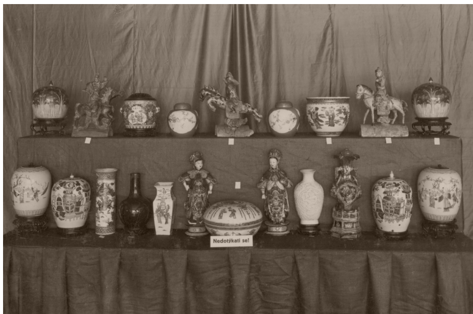
Čínské předměty na výstavě Hlouchovy sbírky ve Veletržním paláci, 1929.