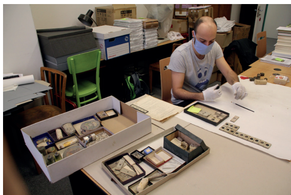
Obr. 8. Část sbírky J. Šulce uložené v paleontologickém oddělení NM.