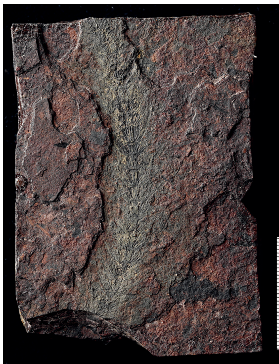
Obr. 10. Přeslička Asterophylites , Nýřany, ze sbírky J. Šulce uložené v paleontologickém oddělení NM.