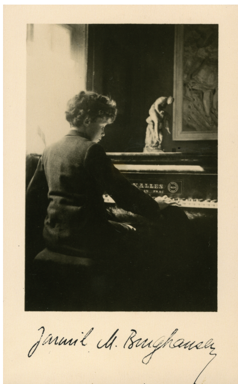
Jarmil Burghauser at age 12, composing at home at the piano. Promotional photo. NM–MAD, acquisition no. 88/98. / Dvanáctiletý Jarmil Burghauser doma při komponování u klavíru. Propagační foto. NM–MAD, č. př. 88/98.

Po studiích se Burghauser rozhodoval, jakými cestami se vydat v oboru dál. V dopise Graciánu Černušákoví z roku 1948 uvedl, že má ambice „[...] především kompoziční, dirigentské a snad i hudebně vědecké“. 14 Nejprve byl zaměstnán jako dramaturg, 15 lektor nově ustavené Akademie múzických umění, a jako sbormistr a dirigent Národního divadla v Praze. V roce 1953 se odvázně rozhodl zůstat ve svobodném povolání, takzvaně na volné noze, a čile komponoval. Zároveň pracoval na teoretických muzikologických i dalších