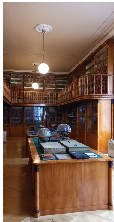
Obr. 14a–b. Ve správě Knihovny Národního muzea je mj. také pražská palácová knihovna knížat Kinských na Staroměstském náměstí, kterou jsme měli možnost navštívit dne 22. října 2025. Majitel knihovny Rudolf kníže Kinský (1802–1836), první kurátor Matice české, knihovnu obohatil o českou historickou a beletristickou literaturu.