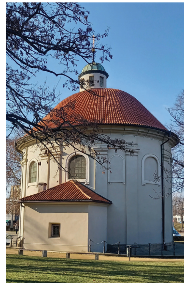
Obr. 2a–b. Dne 2. března 2025 se za velkého zájmu podařila prohlídka kostela sv. Rocha, Šebestiána a Rozálie na Olšanském náměstí.