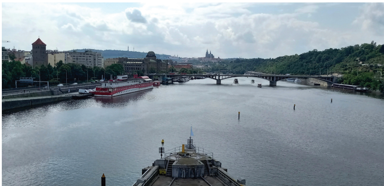
Obr. 7. Z věže vodní elektrárny na Štvanici je úchvatný výhled na historické centrum Prahy.

Ani v srpnu Matice česká nezahálela a připravila pro členy prohlídku areálu budoucího pražského Muzea železnice a elektrotechniky Národního technického muzea u Masarykova nádraží, kde nás překvapila mimořádná zachovalost stavebních prvků z poloviny 19. století. Netradičně pojatou výstavou Poslední muzeum? Karáskova galerie