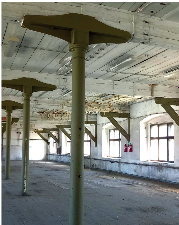
Obr. 10a–b. S kurátory Národního technického muzea jsme měli dne 12. srpna jedinečnou příležitost projít areálem budoucího Muzea železnice a elektrotechniky v blízkosti Masarykova nádraží.