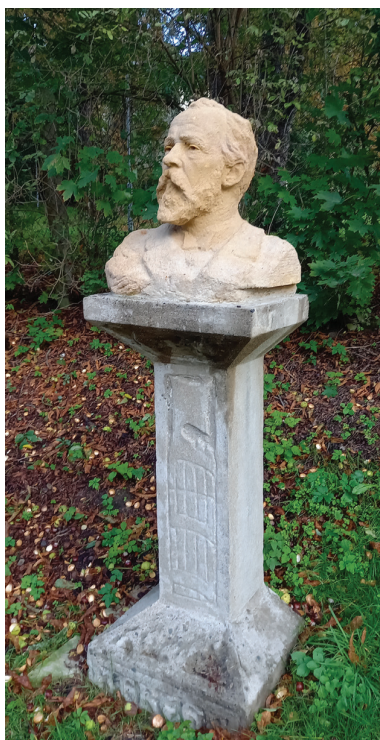
Obr. 13. V roce 2025 se Matice česká finančně podílela na restaurování busty Julia Grégra, která se nachází v lokalitě Na Dole v blízkosti Máslovců. Práce provedla sochařka Radana Čablová.