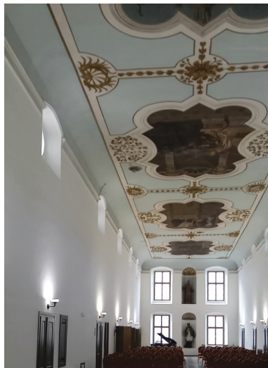
Obr. 1. Letní refektář minoritského kláštera u sv. Jakuba Většího na Starém Městě pražském se stal v červenci 1818 na jeden rok prvním místem, kde nově založené Vlastenské muzeum (dnes Národní muzeum) shromažďovalo sbírky. Areál kláštera jsme navštívili dne 11. února 2025.