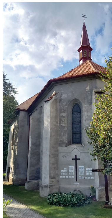
Obr. 12a–c. Dne 28. září 2025 jsme se vydali na Kralupsko. V obci Vepřek jsme navštívili původně gotický kostel Narození Panny Marie a Satranův vodní mlýn s původním vybavením a malým muzeem.