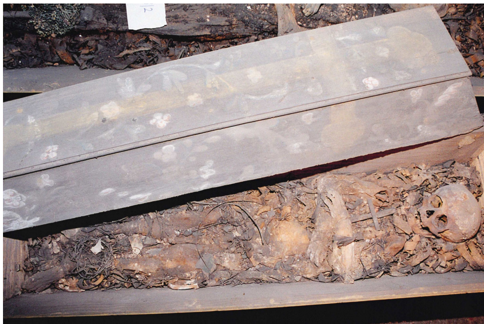
Obrázek 9 – Rakev s ostatky nedospělého jedince č. 3/6 (1971) resp. 3/1 (1999/2000).