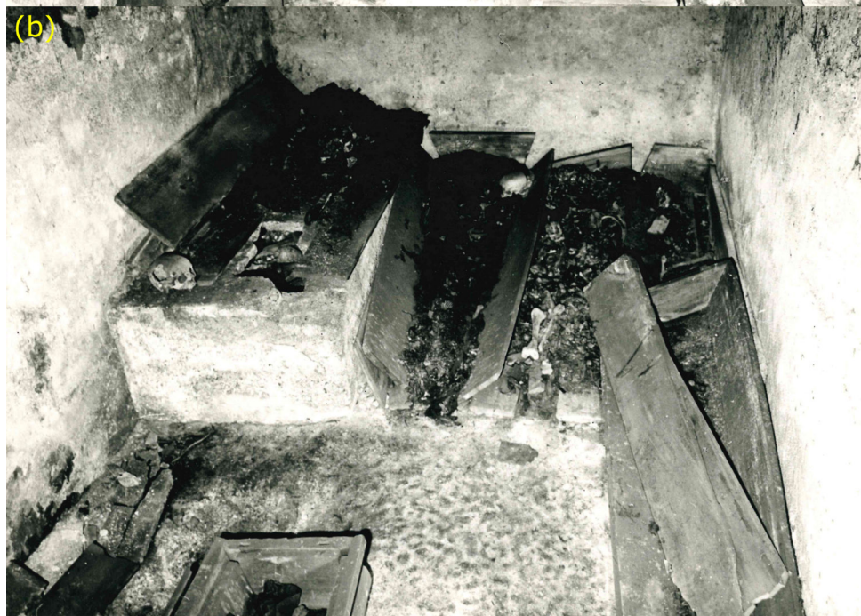
Obrázek 7 – Stav krypty č. 5 na fotografiích z roku 1971 před částečným vyzvednutím ostatků: a) přední část krypty směrem na východ s vchodem na levé straně; b) zadní část krypty směrem na západ.