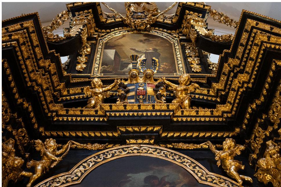
Obrázek 2 – Erb Slavatů z Chlumu a Košumberka na oltáři Panny Marie škapulířové a svatého Šimona Stocka v kostele Panny Marie Vítězné a svatého Antonína Paduánského na Malé Straně v Praze.