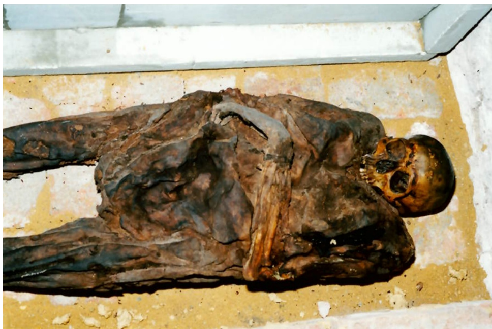
Obrázek 8 – Přírozeně mumifikované ostatky dospělého jedince, u nichž předpokládáme, že pochází ze zděné tumby v kryptě č. 5, a které byly v roce 2001 po rozebrání tumby uloženy a spolu s dalším osteologickým materiálem dodatečně objeveným v kryptě po roce 2000 zazděny do vyprázdněné malé krypty č. 16 (dle označení před r. 1971 krypta č. VII.).

Podle zachovalých mumifikovaných vnějších pohlavních orgánů se jednalo o chlapce. V současné době byla v horní i dolní čelisti na obou stranách přítomna pouze dočasná první a druhá stolička (č. 54, 55, 64, 65, 74, 75, 84, 85). V roce 1971 (Obr. 9) byly přítomny v dolní čelisti ještě přítomny oba dočasné druhé řezáky (č. 72, 82) a levý špičák (č. 73), ty však chybí již od doby dokončení sanace krypty v letech 1999/2000. 107 Ostatní dočasné zuby byly posmrtně ztraceny patrně již v roce 1971. Zároveň byla v horní i dolní čelisti na obou stranách otevřená zubní lůžka s korunkami prvních a druhých trvalých stoliček (č. 16, 17, 26, 27, 36, 37, 46, 47). Věk jedince byl vypočítán pomocí rentgenových snímků čelistí na základě mineralizace trvalého chrupu na 5,44 \pm 0,5 roku. Největší délka těla levé stehenní kosti byla 22,5 cm, což přibližně odpovídá průměrné délce stehenní kosti 6 roků starého jedince a tělesné výšce 119–122 cm. Možnostem ztotožnění tohoto jedince s některým z příslušníků rodu Slavatů z Chlumu a Košumberka či Trauttmansdorffů či dalších jedinců se budeme věnovat dále v diskusi.