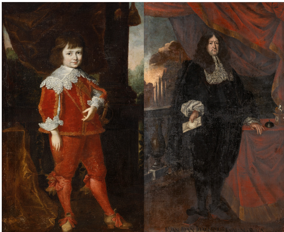
Obrázek 6 – Jan Jiří Jáchym hrabě Slavata z Chlumu a Košumberka (1634/1637–1689), 4. vladař domu hradeckého. Vlevo v dětském věku, vpravo v dospělosti.