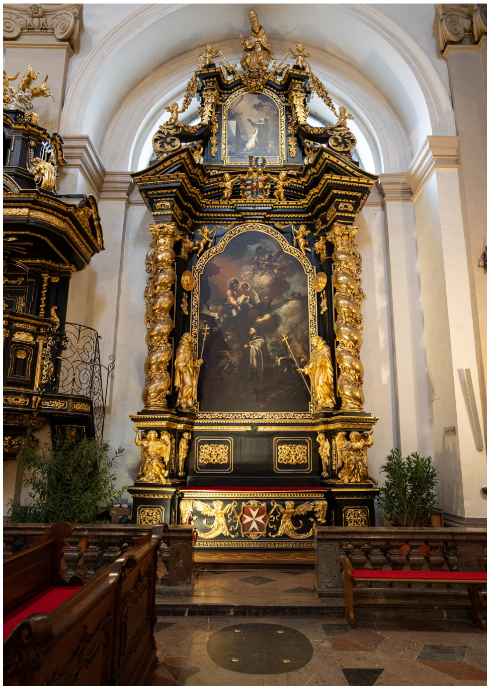
Obrázek 1 – Oltář Panny Marie škapuliřové a svatého Šimona Stocka v kostele Panny Marie Vítězné a svatého Antonína Paduánského na Malé Straně v Praze. Před oltářem se nachází samostatný vstup do krypty č. 5.